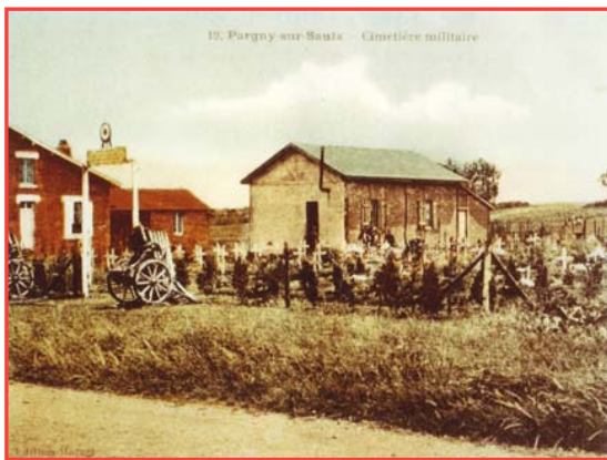
Cimetière militaire dans les années vingt

A toutes et à tous, je souhaite, dès à présent, de bonnes fêtes de fin d'année.