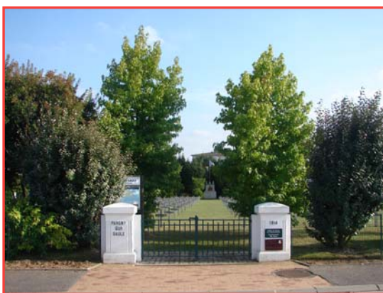
Cimetière militaire de nos jours