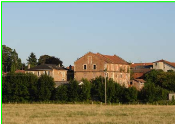
Le Moulin de nos jours

Il existe toutefois un principe fondamental : toute augmentation de la taxe d'habitation entraîne systématiquement celle du foncier non bâti. Il fallait faire un choix !!!